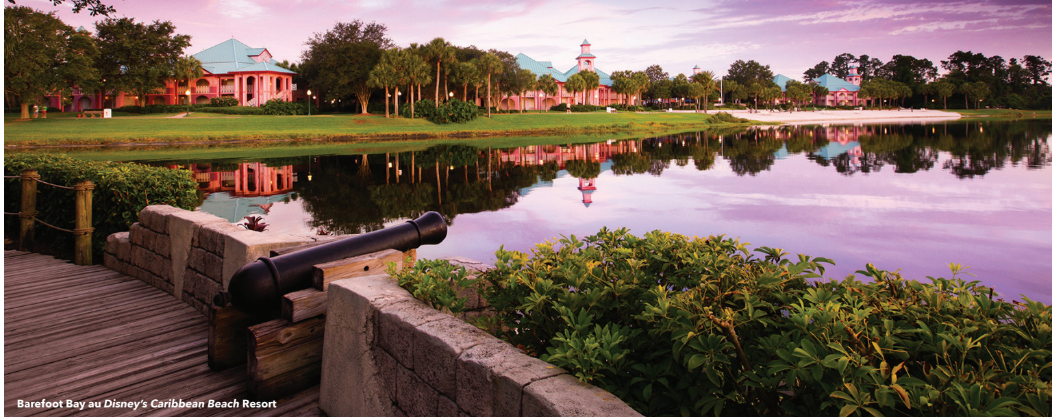
Barefoot Bay au Disney's Caribbean Beach Resort

Dans cet hôtel Disney de catégorie « Moderate », célébrez l'esprit des tropiques : de l'héritage des forts et de l'architecture coloniale aux marchés animés, aux oiseaux exotiques et aux balades relaxantes sur le sable. Chaque complexe insulaire est éclatant, spacieux et coloré, et permet d'accéder à un lac de 45 acres et à des plages sablonneuses.