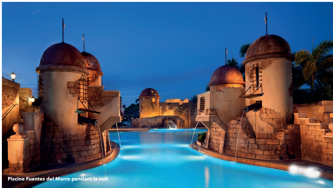
Piscine Fuentes del Morro pendant la nuit