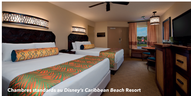
Chambres standards au Disney's Caribbean Beach Resort

Dans cet hôtel Disney de catégorie « Moderate », célébrez l'esprit des tropiques : de l'héritage des forts et de l'architecture coloniale aux marchés animés, aux oiseaux exotiques et aux balades relaxantes sur le sable. Chaque complexe insulaire est éclatant, spacieux et coloré, et permet d'accéder à un lac de 45 acres et à des plages sablonneuses.