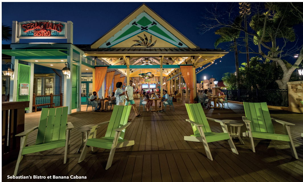
Sebastian's Bistro et Banana Cabana