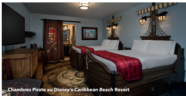
Chambres Pirate au Disney's Caribbean Beach Resort