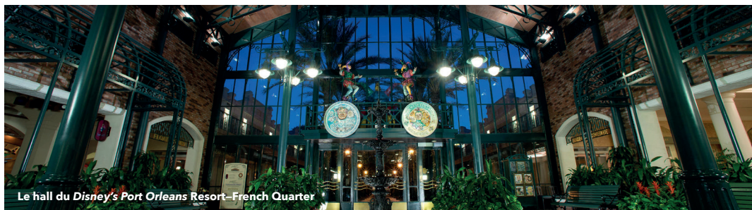
Le hall du Disney's Port Orleans Resort—French Quarter

Service de transport par bateau vers Disney Springs et certains hôtels Disney