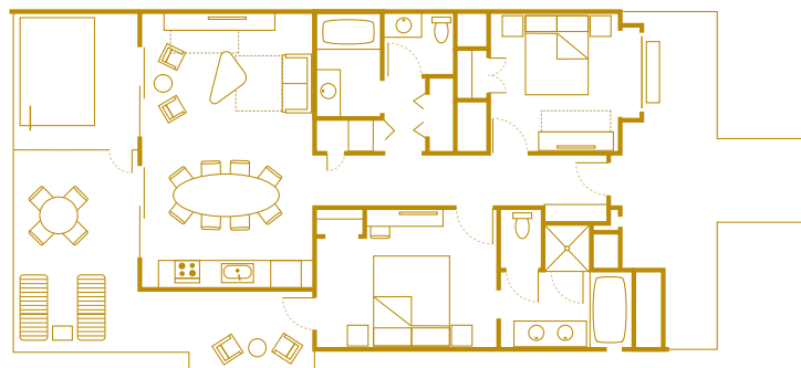
Bungalow : 101,5 m 2 . Les chambres peuvent loger jusqu'à huit visiteurs, plus un enfant de moins de 3 ans dans un berceau.