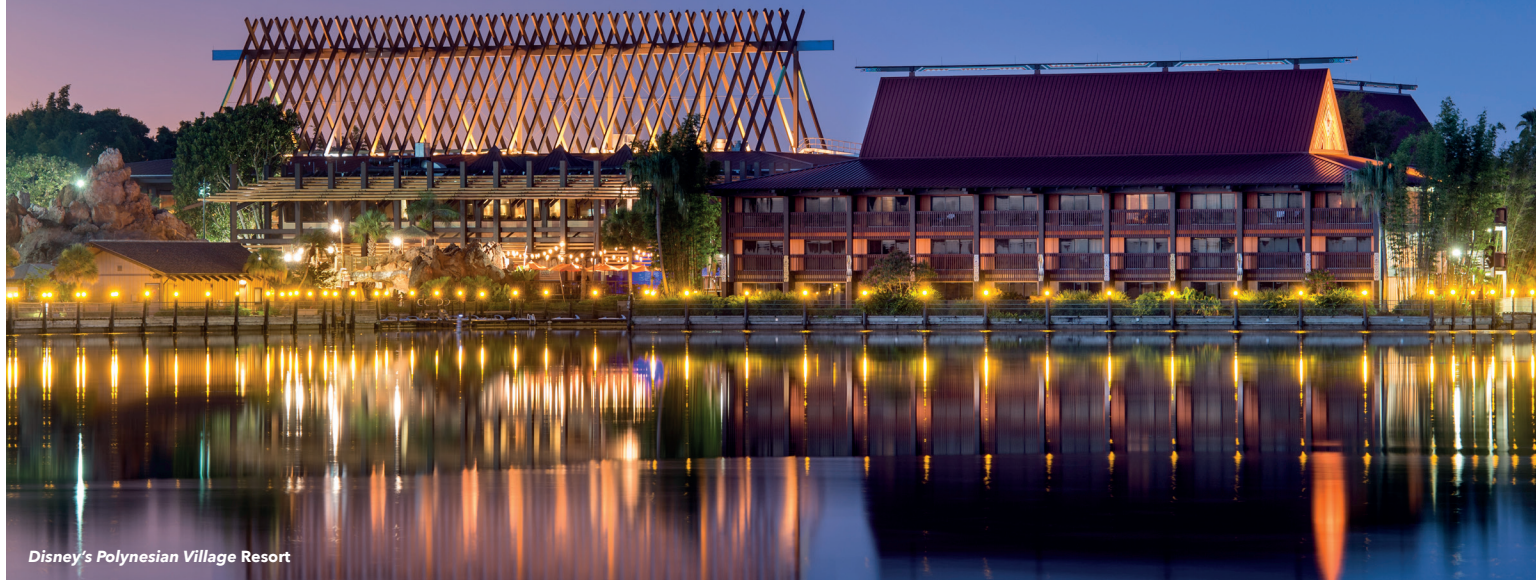
Disney's Polynesian Village Resort

Célébrez l'esprit du Pacifique Sud dans cette oasis de palmiers tropicaux, de végétation luxuriante et bien plus encore! Des nuits au clair de lune plongées dans l'ambiance des îles aux goûts exotiques de nos restaurants de classe mondiale, découvrez l'atmosphère tropicale caractéristique qui a fait du Disney's Polynesian Village Resort une destination Disney préférée.