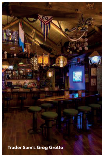
Trader Sam's Grog Grotto

Great Ceremonial House - Essayez une boisson tropicale à cet hommage au dieu tiki avec un service de bar complet et des pupus d'inspiration hawaïenne.