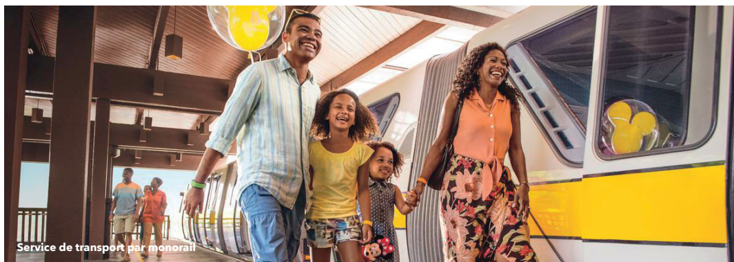
Service de transport par monorail