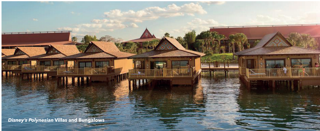
Disney's Polynesian Villas and Bungalows